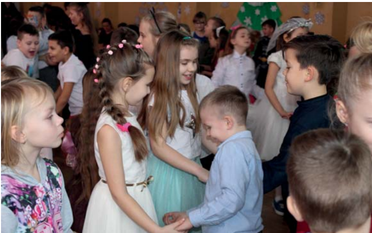
Tradycyjna zabawa choinkowa to okazja do spotkania i zabawy całej społeczności szkolnej.