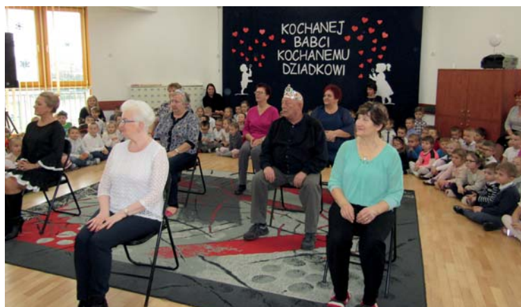
Ciekawe spotkanie zachęciło do zabawy seniorów – gości uroczystości.

Dzieci wręczyły także każdemu z gości upominki oraz złożyły życzenia. Wspomnienia z tej uroczystości na długo zapadną w pamięci naszych kochanych Babć i Dziadków.