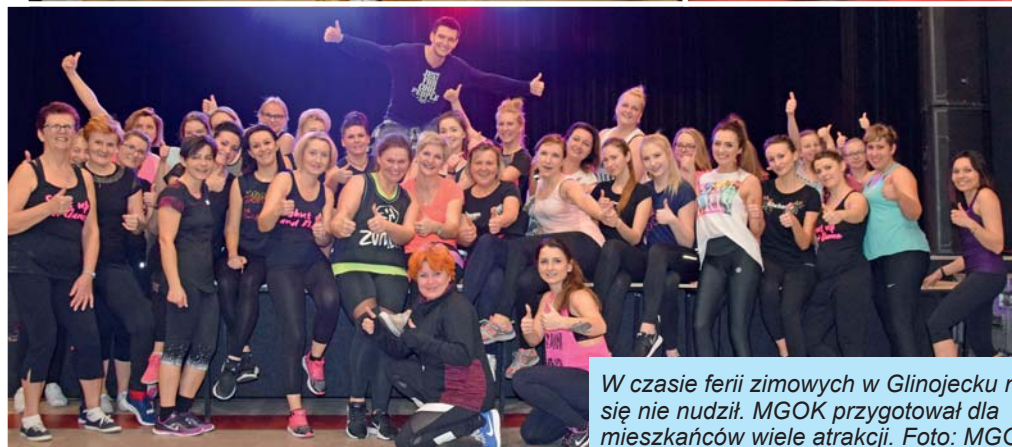
W czasie ferii zimowych w Głinojecku nikt się nie nudził. MGOK przygotował dla mieszkańców wiele atrakcji.