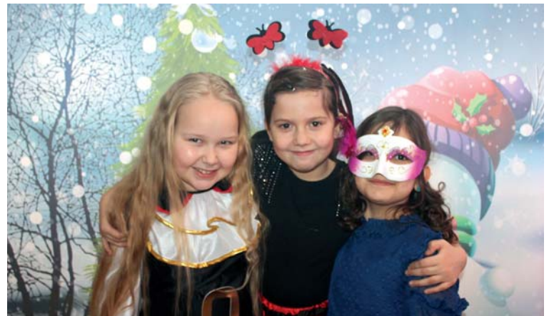
Postaci, w które wcieliły się dzieci podczas zabawy były bardzo interesujące